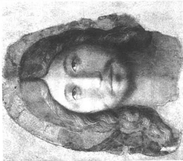
Volto di Cristo dal velo della Veronica - Manoppello

Ufficio Diocesano di Pastorale Matrimonio e Famiglia Vicenza