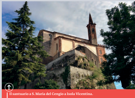
Il santuario a S. Maria del Cengio a Isola Vicentina.

Percorso culturale, artistico e spirituale in preparazione alla Pasqua.