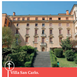
Villa San Carlo.

Alcune proposte per continuare a far ardere nel cuore il desiderio d'incontrare il Signore Gesù.