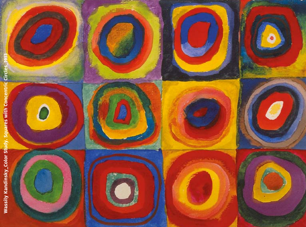
Wassily Kandinsky_Color Study_Squares with Concentric Circles_1913

DIOCESI DI VICENZA PASTORALE VOCAZIONALE