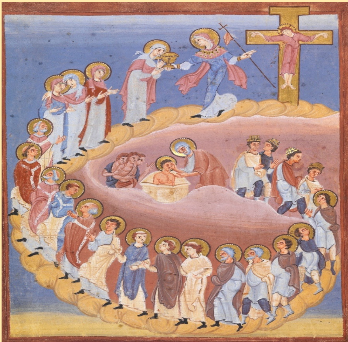
Miniatura medioevale del Cantico dei cantici – Biblioteca civica di Bamberg