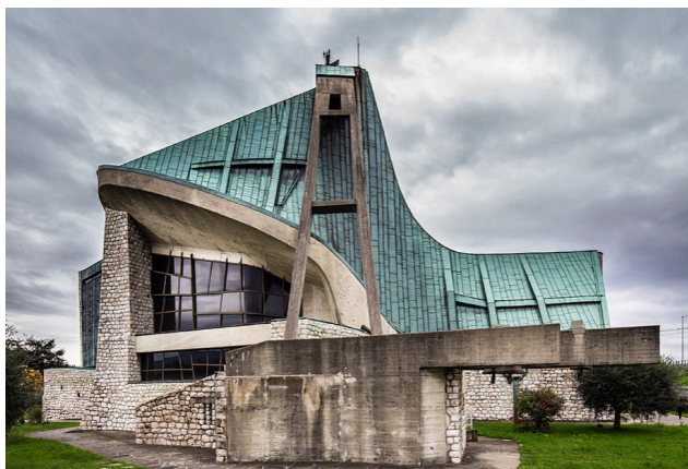
Giovanni Michelucci, Chiesa di San Giovanni Battista a Campi Bisenzio - Firenze (1960-1964)

Date: 23-30 gennaio / 6-13-20-27 febbraio 6-13-20-27 marzo / 3-10 aprile