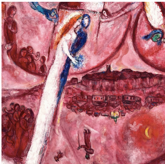
Marc Chagall, Cantico dei Cantici III (1960)

Date: 21-28 gennaio / 4-11-18-25 febbraio 4-11-18-25 marzo / 1-8 aprile