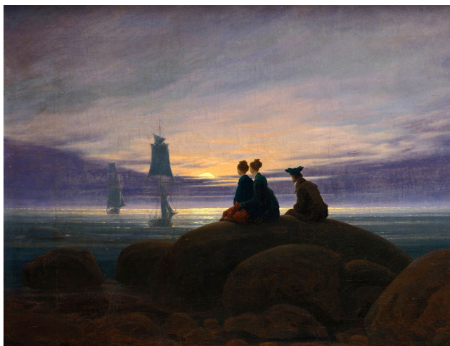
Caspar David Friedrich, Luna nascente in riva al mare (1822)

Date: 24 settembre / 1-8-15-22-29 ottobre 12-19-26 novembre / 3-10-17 dicembre