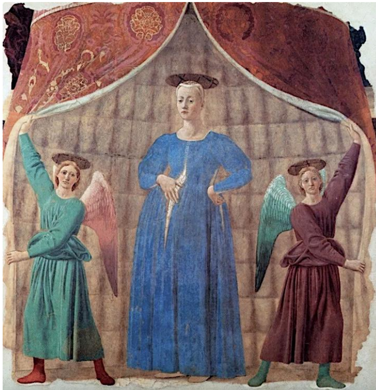
Piero della Francesca, Madonna del parto , 1450- 1465. Monterchi, Musei Civici della Madonna del parto, proveniente dalla cappella di Santa Maria di Momentana.