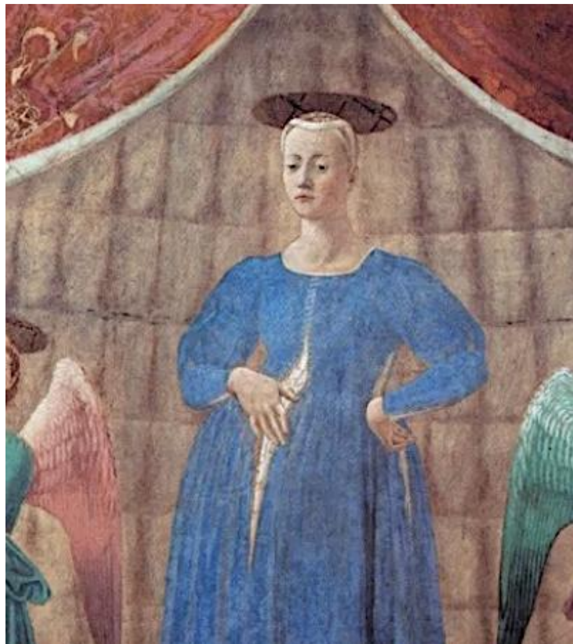
Piero della Francesca, Madonna del parto , 1450- 1465. Monterchi, Musei Civici della Madonna del parto, proveniente dalla cappella di Santa Maria di Momentana. Particolare.