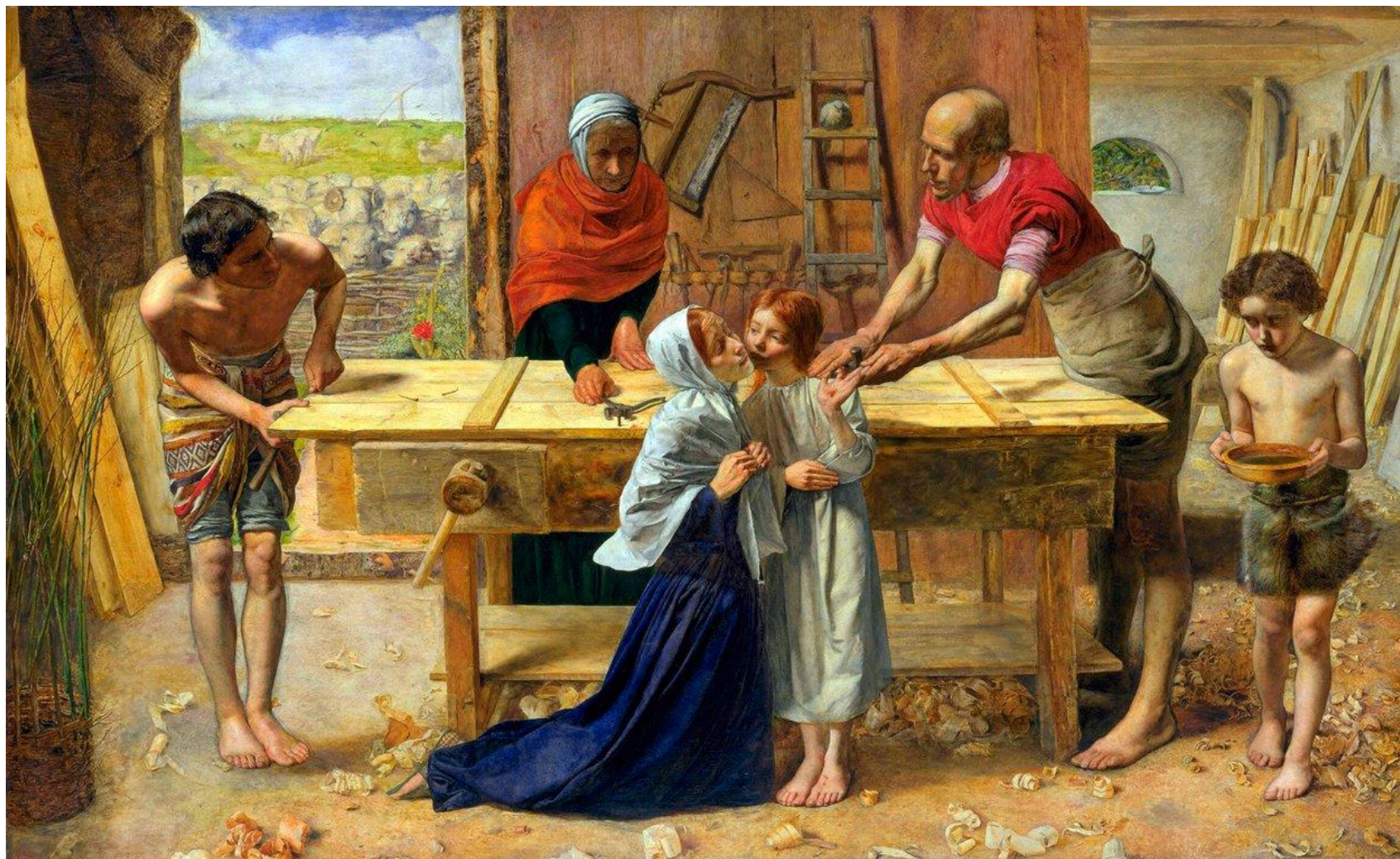
John Everett Millais, Cristo nella casa dei suoi genitori, 1850