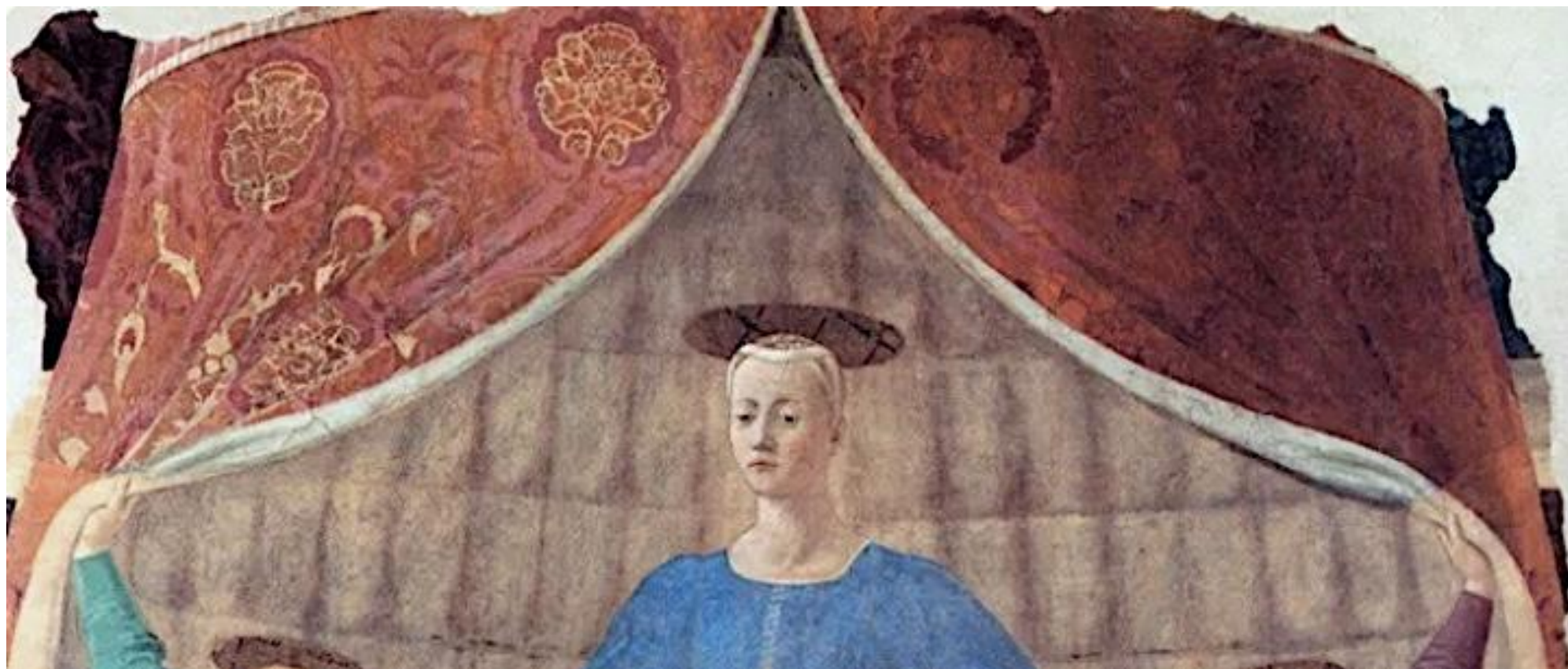
Piero della Francesca, Madonna del parto , 1450-1465. Monterchi, Musei Civici della Madonna del parto, proveniente dalla cappella di Santa Maria di Momentana. Particolare.