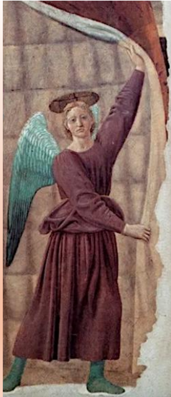
Piero della Francesca, Madonna del parto , 1450-1465. Monterchi, Musei Civici della Madonna del parto, proveniente dalla cappella di Santa Maria di Momentana. Particolare.