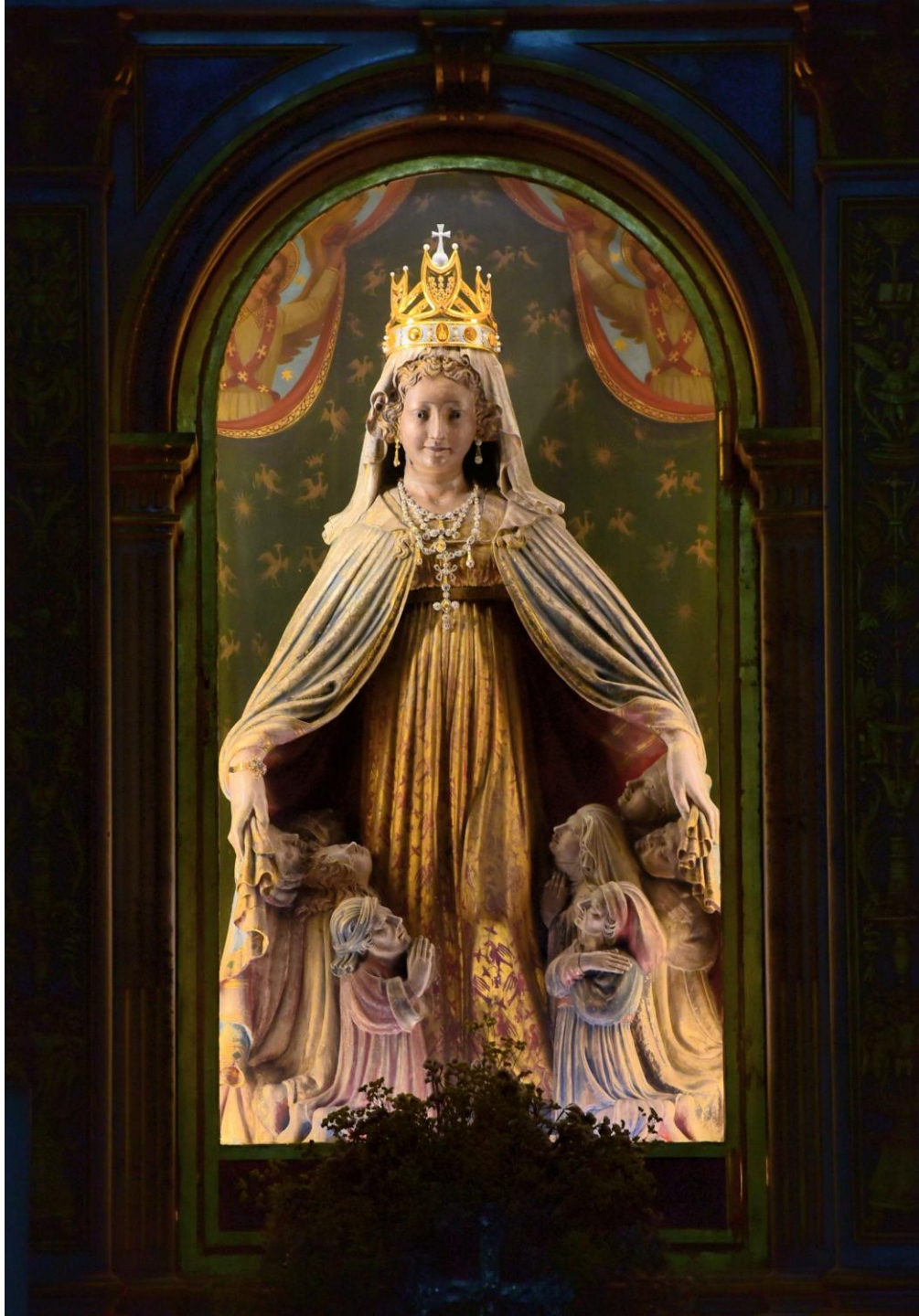
Madonna di Monte Berico, Madre della Misericordia, opera in pietra tenera dei Berici di Nicolò da Venezia, 1428.